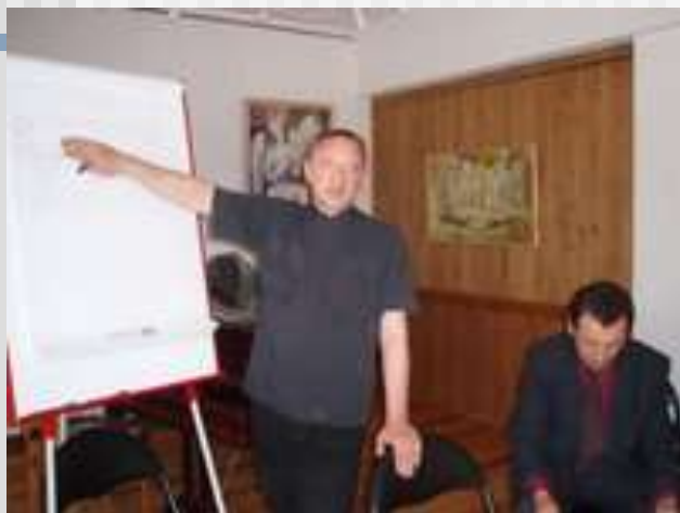
Panevėžio r. VVG strategijos rengimo posėdis