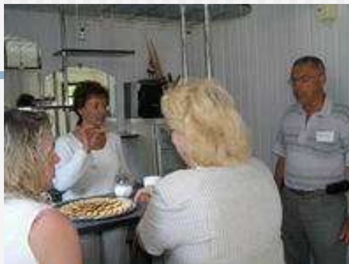
Kauno r. VVG mokymo seminaras